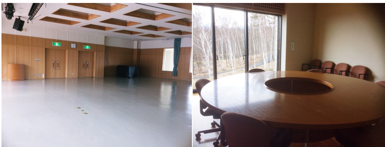
大研修室(左)・会議室(右)

※大研修室内では同じ会場で古楽関係のイベント(ワークショップ等)を同時開催します。 また、9/17(日)は自然文化園野外で八ヶ岳マルシェ(別団体)の開催も予定しておりますので、 3日間で相当数の一般来場者が見込まれます。